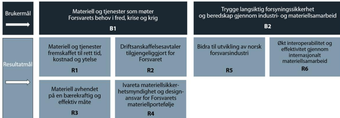
Figur 2: Målbilde 2025