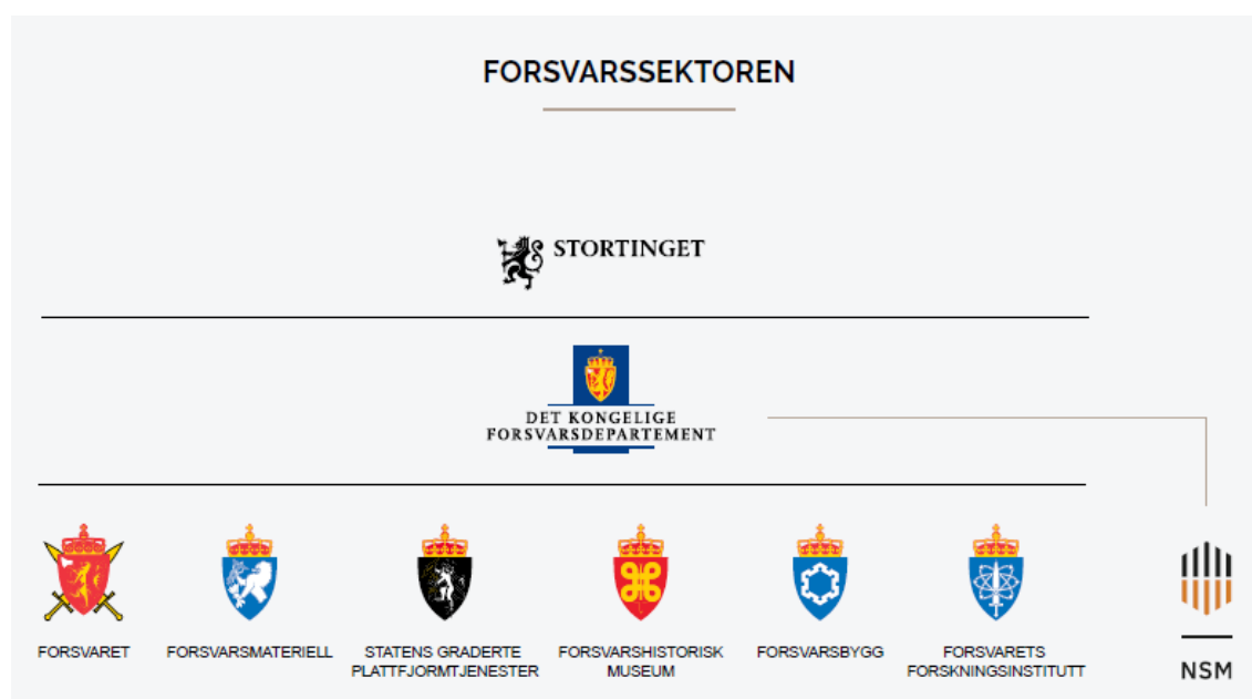
Figur 1: Forsvarssektoren

I juni 2025 implementerte Forsvarsmateriell og Forsvaret en ny aktørmodell for materielldrift og vedlikehold. Ved overgangen til ny aktørmodell bortfalt Forsvarsmateriells helhetlige ansvar for å ivareta eierskapsforvaltningen av sektorens materiell over levetiden. Forsvaret er gitt et større ansvar for drift og vedlikehold, og de har introdusert rollen flåteansvarlig for å håndtere materiell med flere brukere. Forsvarsmateriell trer inn i rollen som materiellsikkerhetsmyndighet og designansvarlig. Den nye aktørmodellen fordrer et tett samarbeid mellom Forsvaret og Forsvarsmateriell.