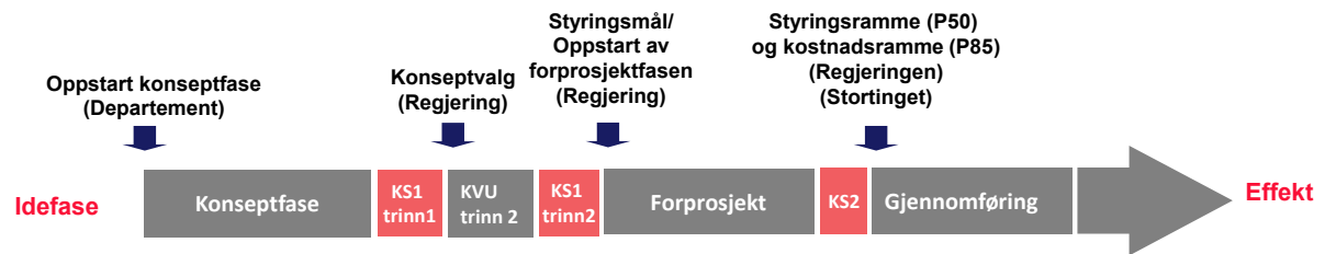
Figur 4.2 Statens prosjektmodell ved KVVU og KS1 i to trinn

I saker som omhandler arealinngrep, vil planlegging skje i hht. plan- og bygningsloven, med lovmessige krav til høring mv. Prosessene etter plan- og bygningsloven gjelder uavhengig av dette rundskrivet. I arbeidet med prosjektets fremdriftsplan bør det vurderes hvordan prosessen kan legges opp for å bidra til en effektiv gjennomføring. Normalt vil reguleringsarbeidet inngå som en del av forprosjektfasen i prosjektet. I samferdselsprosjekter vil arbeidet med forprosjektfasen være delt opp i ulike deler, normalt kommunedelplan og reguleringsplan, og strekke seg over lengre tid enn i mange andre prosjekter.